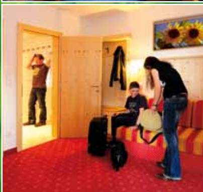
Familiensuit Morgenrot | Cam. fam. Morgenrot