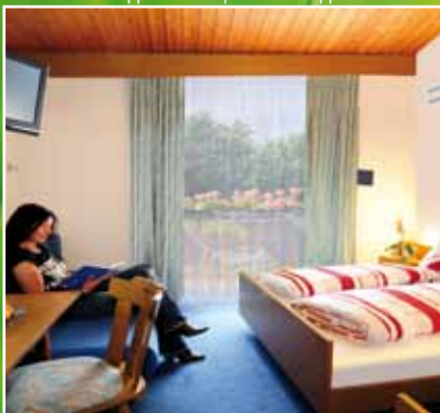
Standard Doppelzimmer | Camera doppia Standard